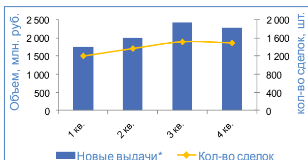
Новый бизнес в 2013г., поквартально